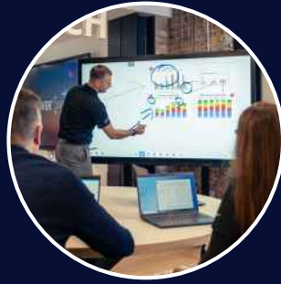
Optimierte Zusammenarbeit im Meetingraum