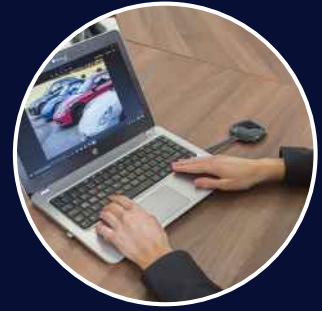
Content auf Knopfdruck übertragen